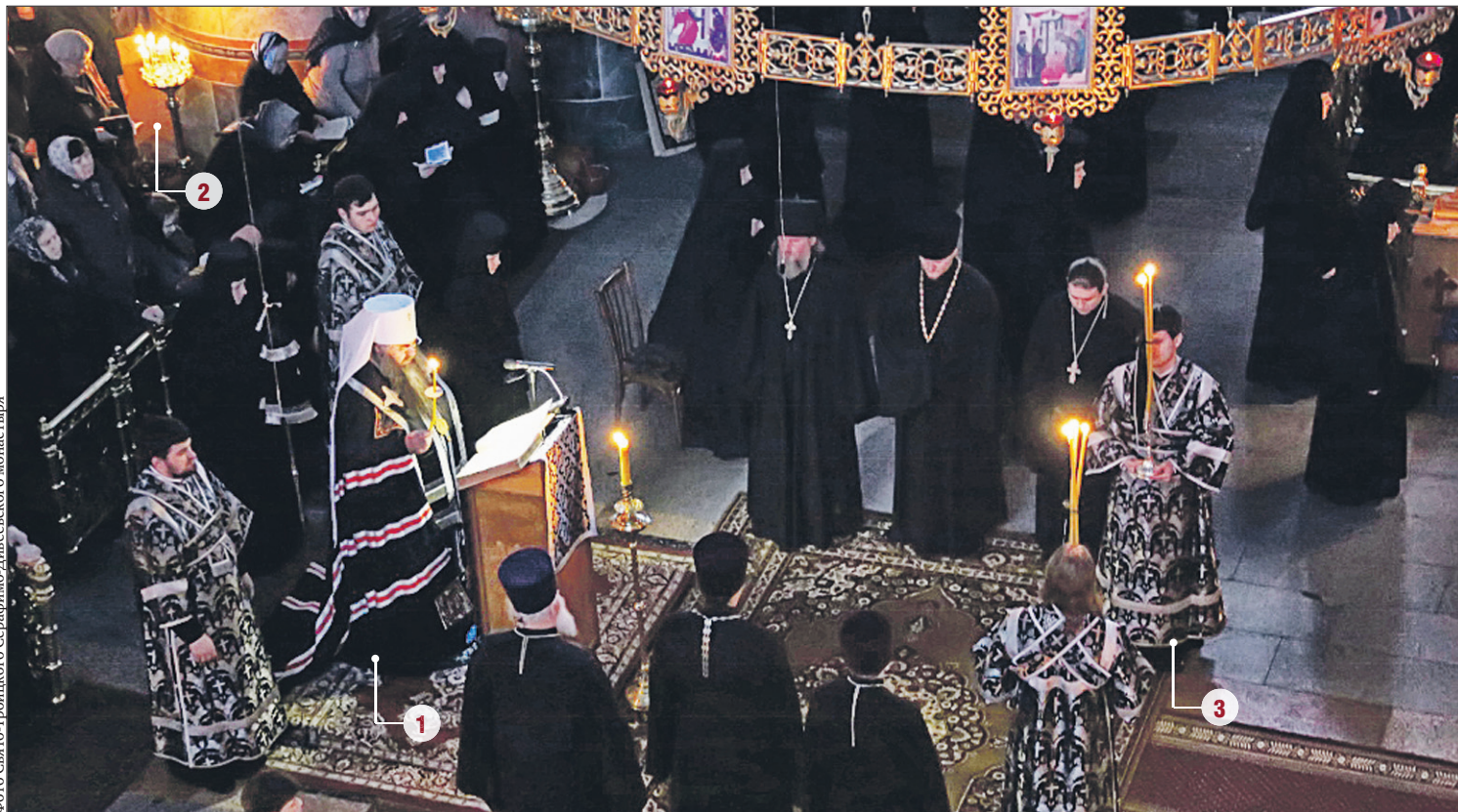
Фото Свято-Троицкого Серафимо-Дивеевского монастыря

На утрени четверга (то есть вечером в среду) пятой седмицы поста весь канон прочитывается вновь: предполагается, что под конец Святой Четыредесятницы верующие готовы воспринять его целиком. Кроме того, мы слушаем житие преподобной Марии Египетской — для укрепления примером глубочайшего покаяния этой святой. Вся служба получила название «Мариино стояние».